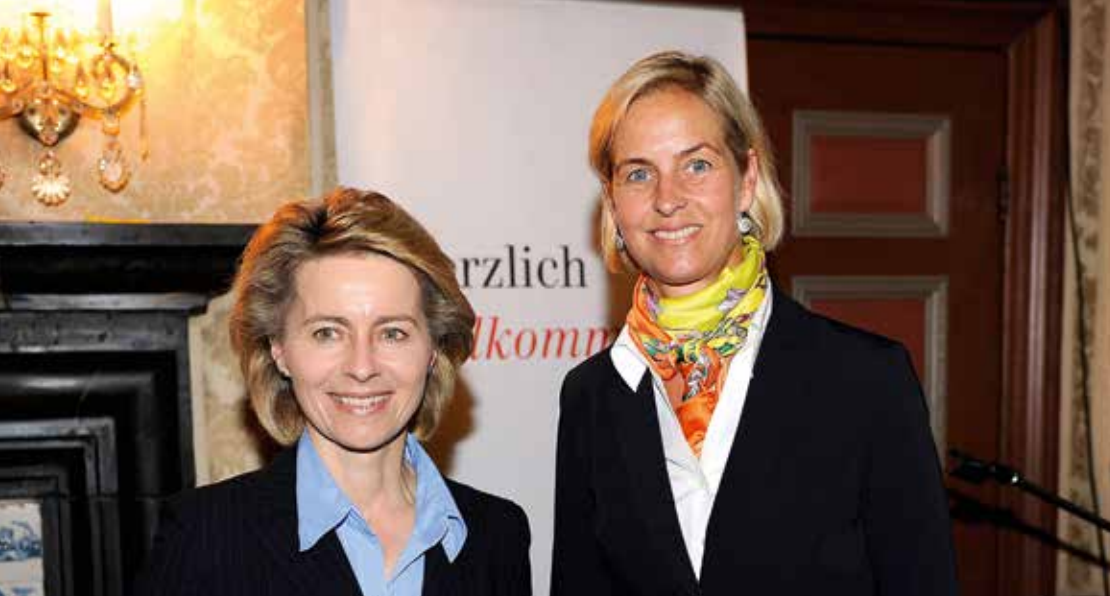
DR. URSULA VON DER LEYEN MdB Bundesministerin für Arbeit und Soziales